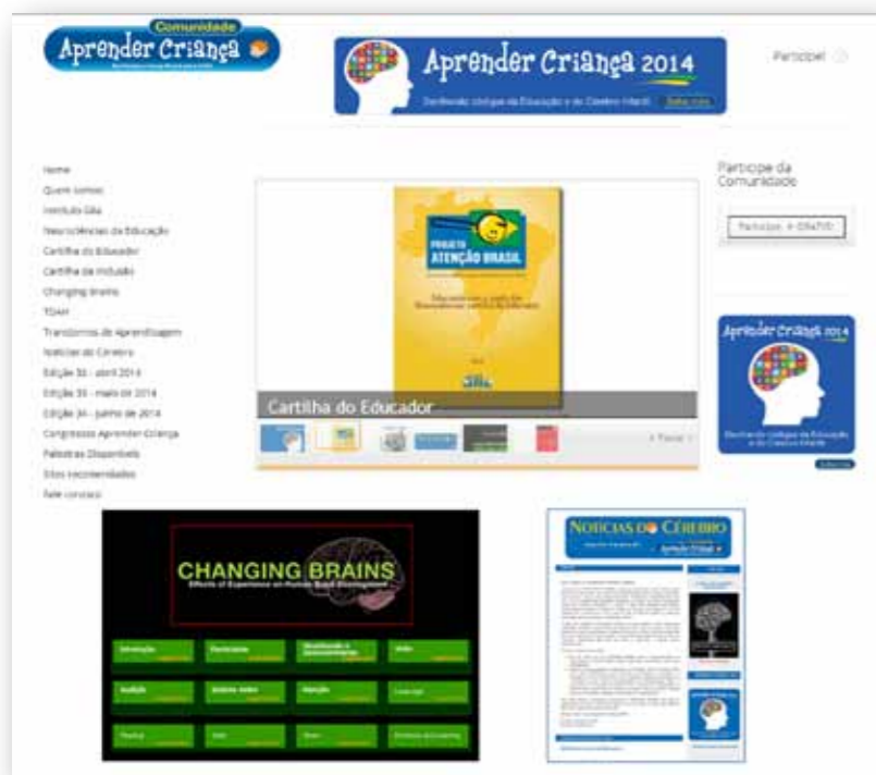
Portal da Comunidade Aprender Criança www.aprendercrianca.com.br

Entre as contribuições mais importantes da Comunidade Aprender Criança destaca-se o Projeto Atenção Brasil 19 , um amplo e inédito estudo populacional iniciado em 2009 e ainda em andamento, realizado a partir de uma amostra final de 5.961 crianças e adolescentes de 87 cidades e 18 estados, cobrindo as cinco regiões nacionais. Com a participação voluntária de mais de mil membros da Comunidade, após planejamento amostral cuidadoso, foram selecionados 124 professores que representavam adequadamente a distribuição demográfica da população infantil Brasileira. Esses professores foram treinados via internet em como selecionar a amostra e aplicar os questionários aos pais e professores. A fase inicial do projeto resultou em mais de duas dezenas de artigos científicos publicados em revistas indexadas, além de prêmios em congressos nacionais e internacionais. No entanto, há que se destacar o fruto mais importante desse estudo, a “Cartilha do Educador: educando com a ajuda das Neurociências” 20 .