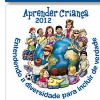
Logolemas dos congressos bianuais Aprender Criança desde 2006.